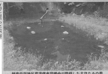
網走西部地区資源保全協議会が整備した北ほたるの里